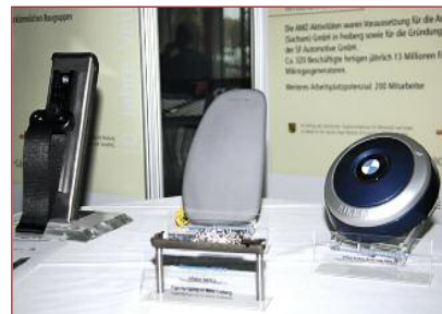
Airbags und ihr Innenleben. Gasgeneratoren und Treibsätze dafür entstehen bei Takata-Petri und SF Automotive in Freiberg. AMZ hat diese Ansiedlung bzw. Firmengründung maßgeblich vorangetrieben.

Weil technische Innovationen untrennbar mit Investitionen, Finanzierungen und wei-