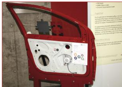
Tür mit neuem elektrischem Kunststoffmotor von der Steffen Söhner GmbH für den Fensterheber. AMZ unterstützt bei der Entwicklungsplanung und Kontaktabbahnung zu potenziellen Kunden.