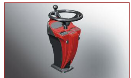
Messmodell zur Visualisierung eines Ideenkonzepts für ein Lenksäulensystem der Fahrzeugtechnik Miunske GmbH. Modell: Kupfer.Rot

stellung mit sinnvoller, nachhaltiger Produktgestaltung. Uns geht es um den Systemansatz“, sagt die diplomierte Produktgestalterin (FH), die zugleich eine Qualifikation als Projektingenieur hat und sich nicht als reine Industriedesignerin versteht. „Wir fassen unsere Aufgabe um einiges weiter“, sagt sie und verweist darauf, dass neben gestalterischer Kreativität genauso technisches Wissen, Managementfähigkeiten und die Fähigkeit zu neuen Denkstrukturen notwendig sind, um eine Produktentwicklung nachhaltig mit Erfolg zu krönen. Mit dieser speziellen Dienstleistung gewinnt das 2003 gegründete Büro zunehmend mittelständische Unternehmen der Region als Kunden. Um die eigenen Kompetenzen kontinuierlich auszubauen, sucht Kupfer.Rot den fachübergreifenden Erfahrungsaustausch und hat dafür u. a. das Produktentwicklerforum ins