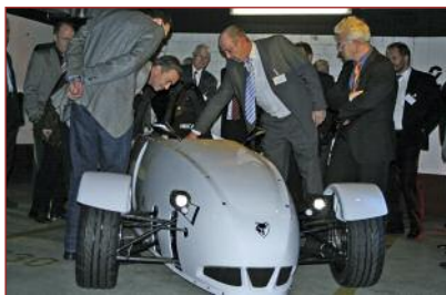
Dicht umlagert von den Gästen der AMZ-Lounge war der Extremsportwagen e-Wolf e-1.