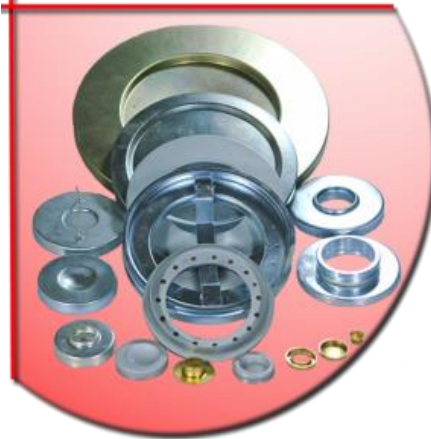
Filterfassungen und Deckel