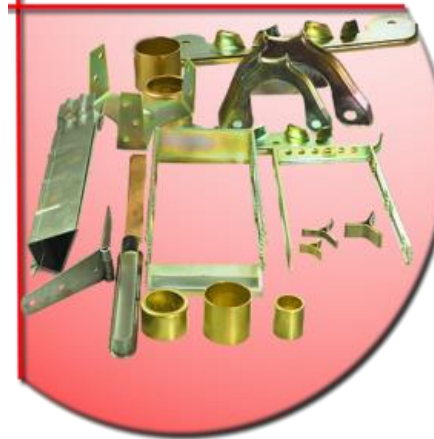
Stanz- und Tiefziehteile